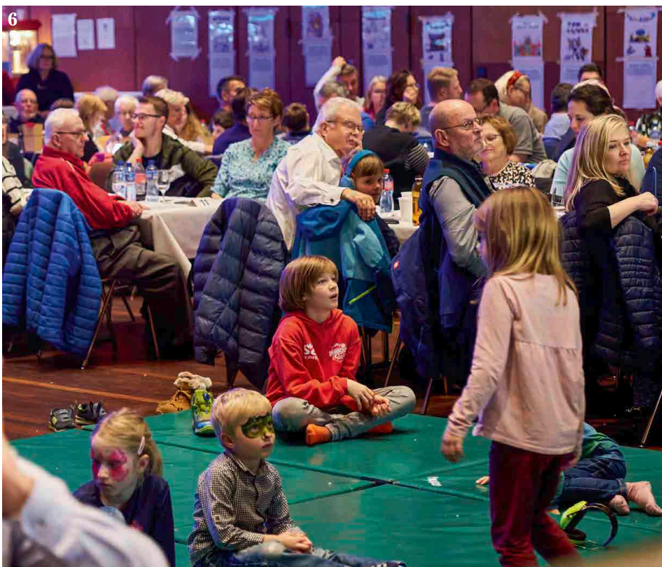
5 Viele konzentrierte Gesichter auf der Bühne ... 6 ... und auf den Spielmatten davor. 7 Alles wurde vom Jahreskonzert-OK bis ins Detail geplant – Blumen-deko auf der Bühne inklusive.