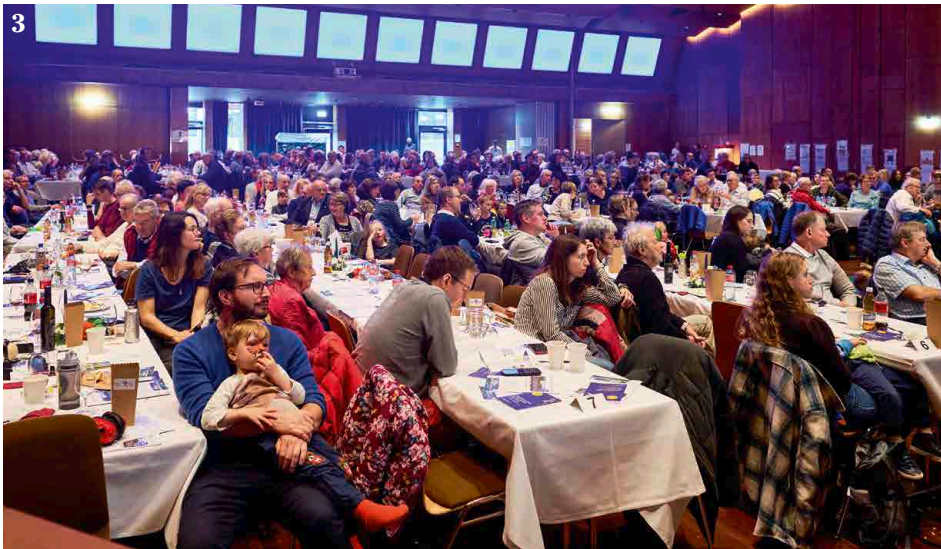
1 Beim Ehrenapéro stimmte man sich beim einen oder anderen Gläschen auf den Abend ein. 2 Die PMZ-Fotowand wurde rege genutzt. 3 Die Reihen waren gefüllt mit Publikum jeglichen Alters. 4 Das Ausprobieren der Instrumente war der Hit.